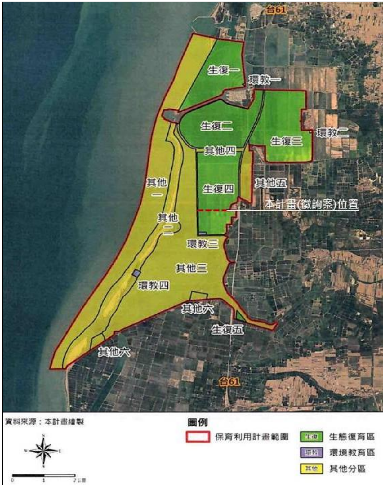
本案位置與「七股鹽田國家重要濕地(國家級)」保育利用計畫(草案)範圍。