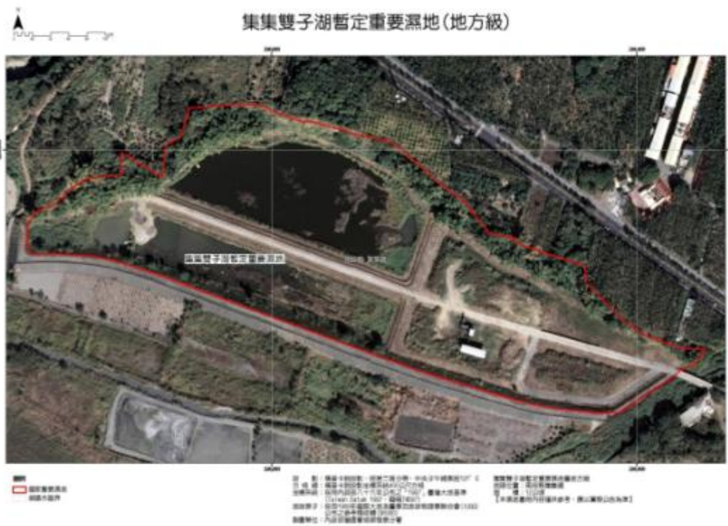
圖 3. 集集雙子湖濕地公告範圍