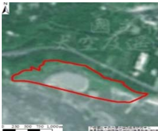
(b)民國 87 年 SPOT 衛星影像，該濕地堆放砂石