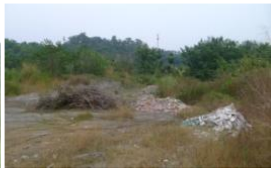
水池被回填之現況