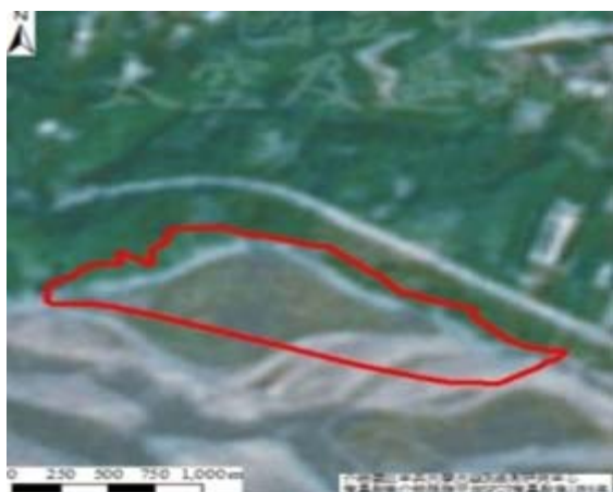
(a)民國 85 年 SPOT 衛星影像，該濕地為草地