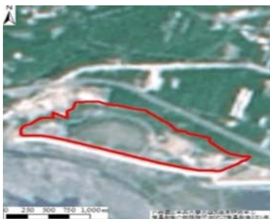
(c)民國 90 年衛星圖，砂石移除