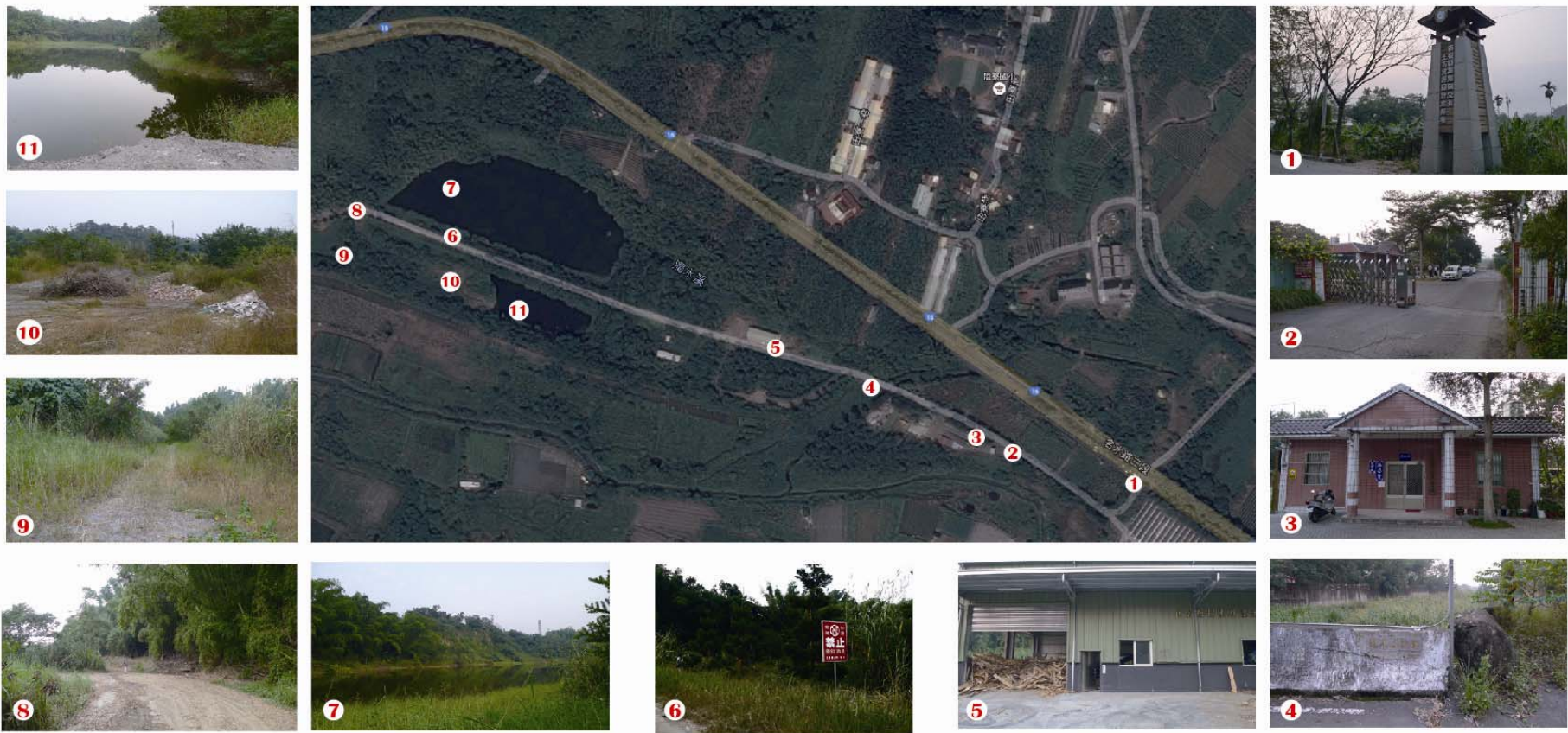
圖 4. 集集雙子湖濕地環境照片與 GPS 點位