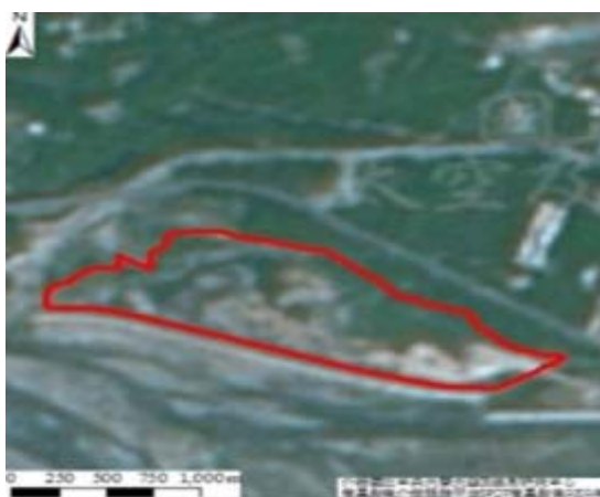
(d)民國 91 年填土及水域形成