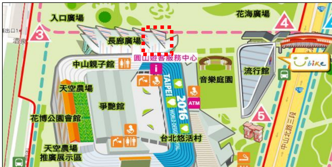
圖 1. 本活動辦理地點位置圖