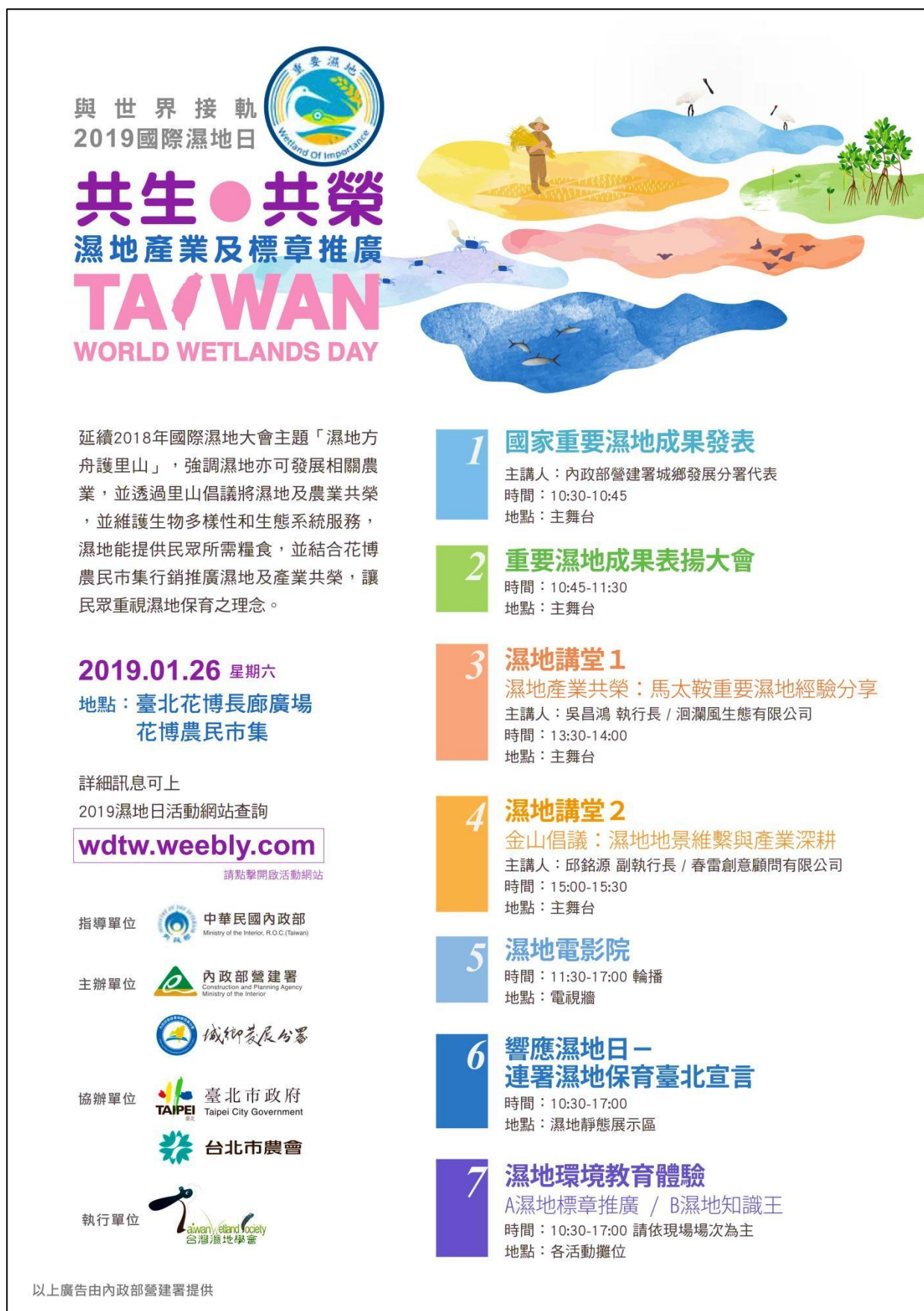
圖 3. 本活動海報