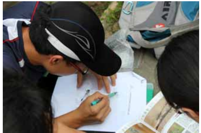
陸域動物調查實習—紀錄捕獲的昆蟲