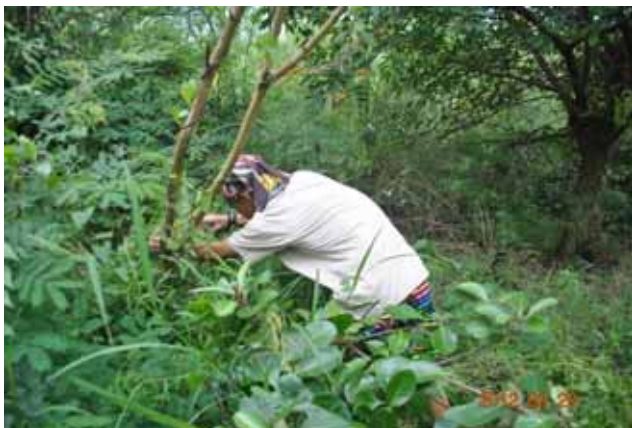
社區志工執勤一步道環境整理