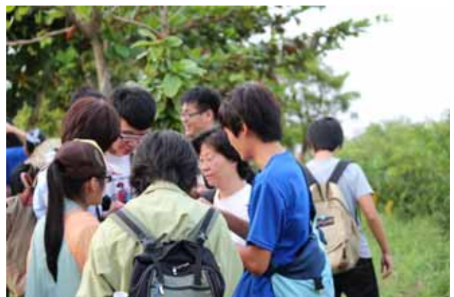
陸域動物調查實習—分組教學