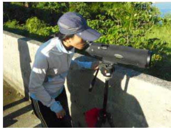
巡守隊員以單筒望遠鏡觀察龍鑾潭鳥類