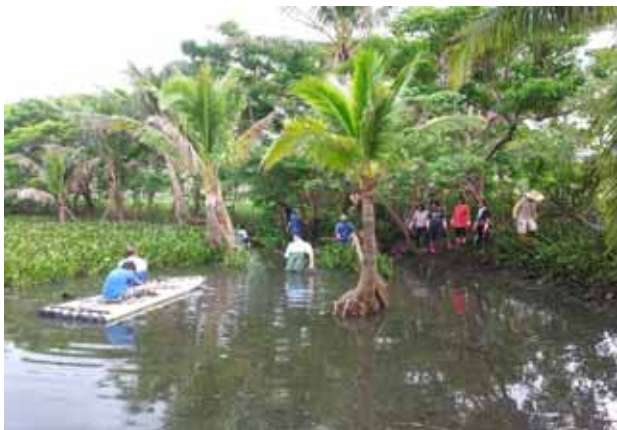
社區志工執勤一清除鷺鷥林下外來種的布袋蓮