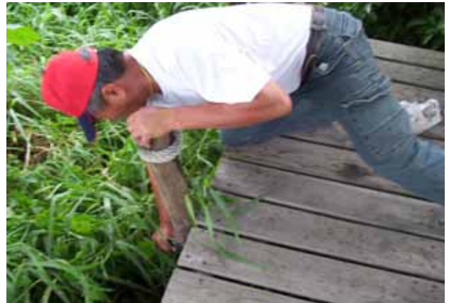
社區志工執勤一埤仔頭木棧道整修之二