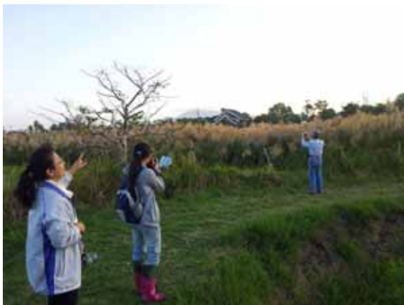
巡守隊員攝影記錄植物狀況。