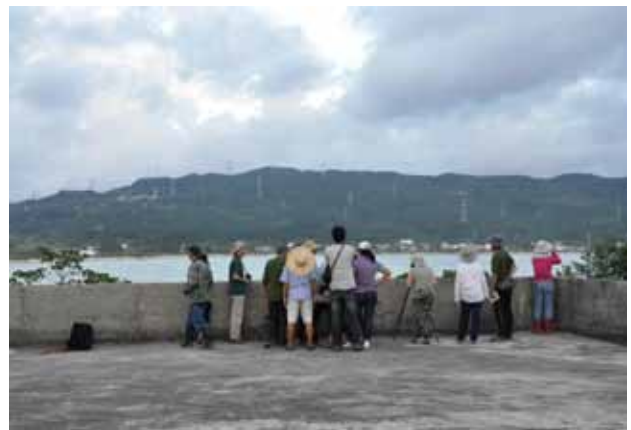
鳥類觀察與解說戶外課程—於福鑾宮廣場觀賞龍鑾潭潭面上的雁鴨。