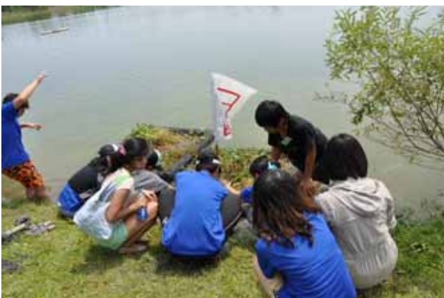
水生植物實習—水生植物浮島製作：分組完工後的浮島插上隊旗。