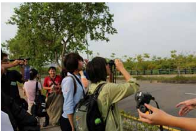
陸域動物調查實習—鳥類調查