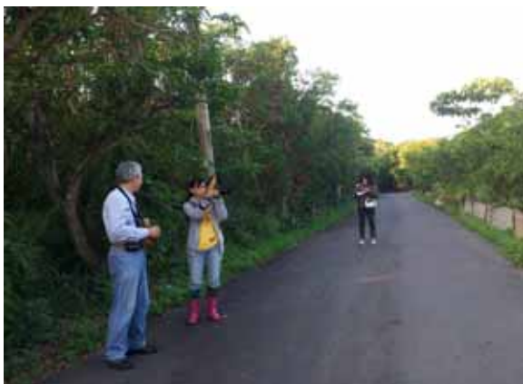
晨間鷺鷥林巡守調查。