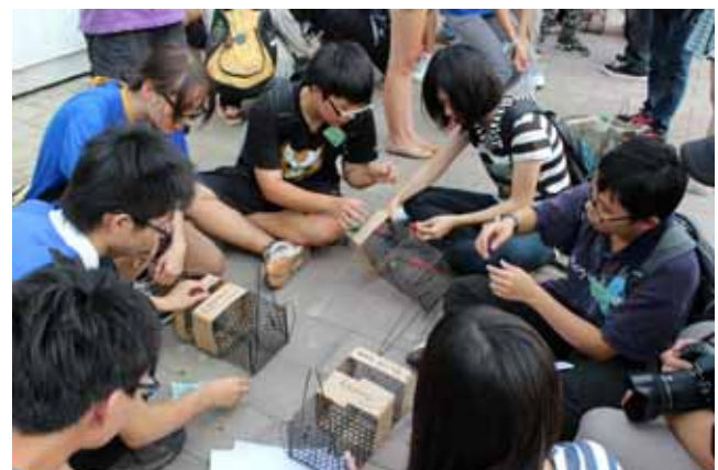
陸域動物調查實習—分組製作小型動物陷阱