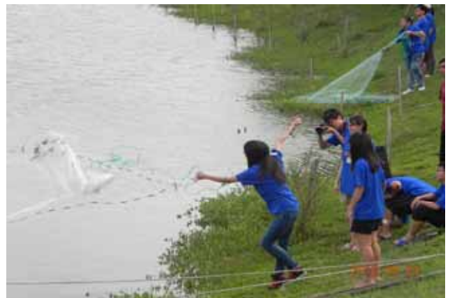
水域動物調查實習—學員們認真練習手拋網