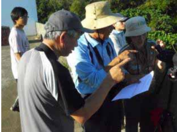
龍水生態旅遊團隊於龍水社區生態旅遊路線進行鳥類監測培訓