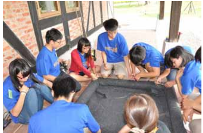
水生植物實習—水生植物浮島製作：同心協力完成浮島底座