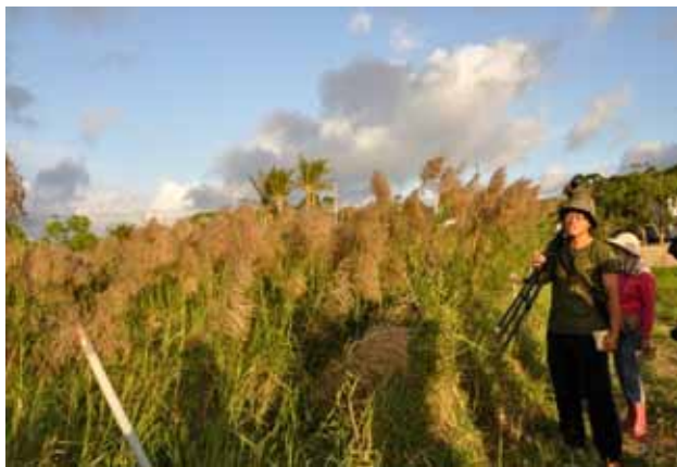
鳥類觀察與解說戶外課程—看到什麼就講什麼，沿途植物也一併解說。