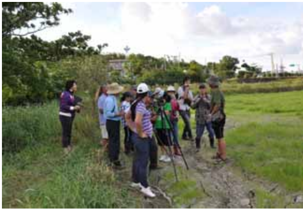
鳥類觀察與解說戶外課程—指導解說志工望遠鏡的使用技巧。