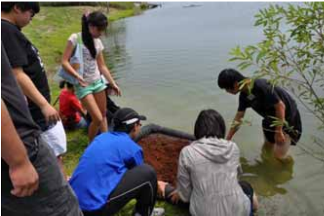
水生植物實習—水生植物浮島製作：完成底座後要舖上介質