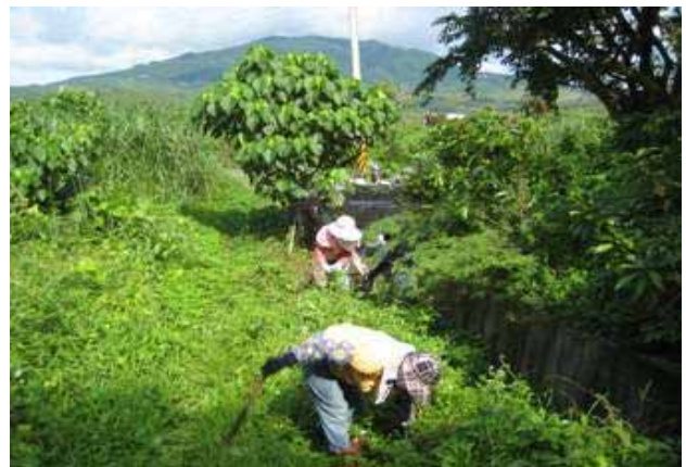
社區志工執勤一渠圳環境整理