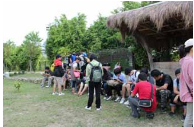
陸域動物調查實習—認真的學員