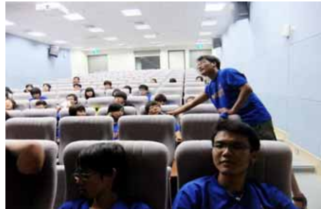
恐怖的課堂—隨時抽考