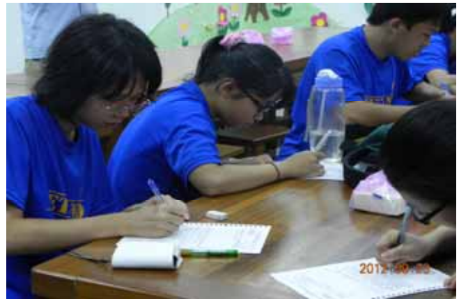
研習心得撰寫—認真的學員