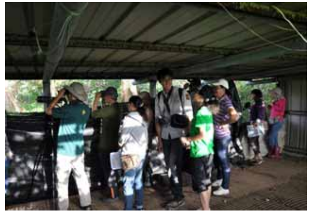
鳥類觀察與解說戶外課程—觀察及講解鳥類辨識技巧。