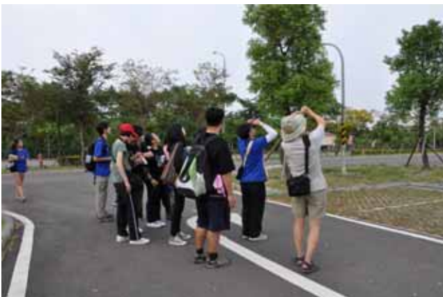
最操勞的研習營隊—大清早還要起來晨間鳥調實習