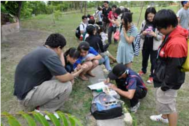
陸域動物調查實習—認真的學員