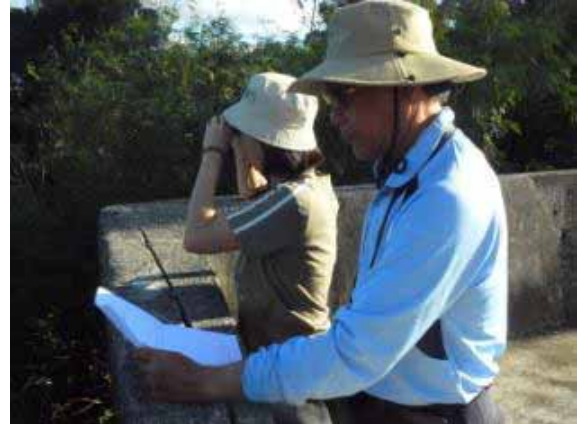
監測人員將監測結果紀錄於監測表格