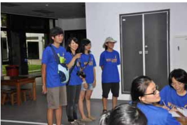
勞苦功高的小隊輔幹部群