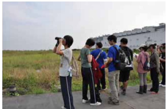
最操勞的研習營隊—大清早還要起來晨間鳥調實習