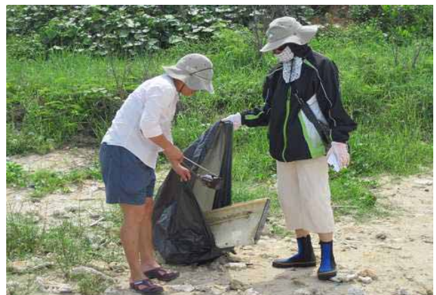
社區志工執勤一環境整理