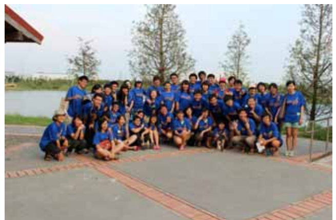
實習課程後大合照