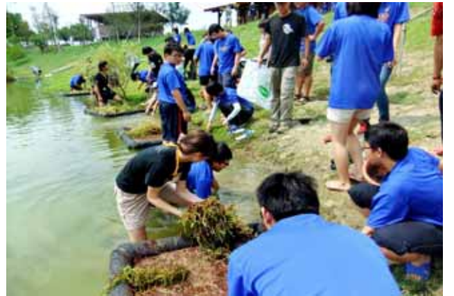
水生植物實習—水生植物浮島製作：舖好介質後開始下水種植水生植物