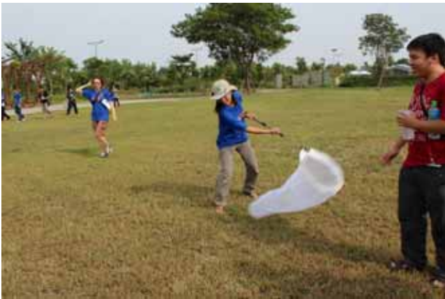
陸域動物調查實習—捕蟲網使用