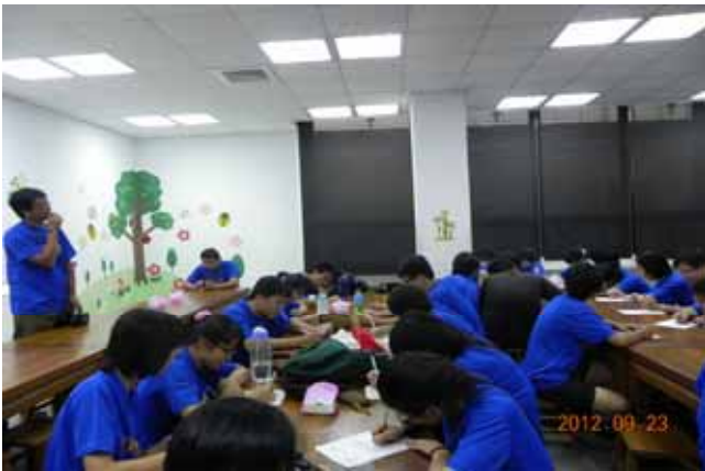
營隊執行長主持研習心得撰寫