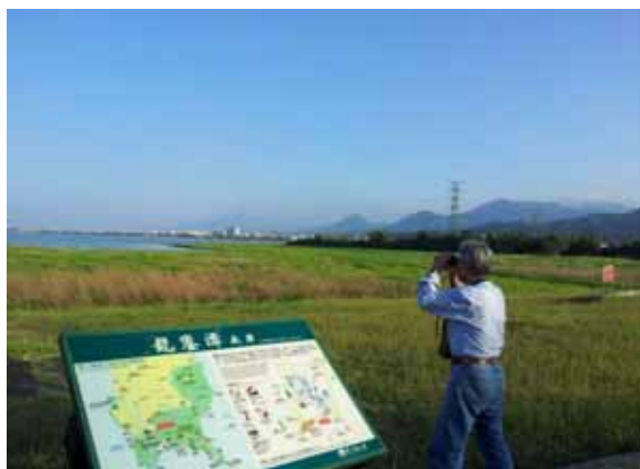
巡守隊員龍鑾潭南岸觀察。