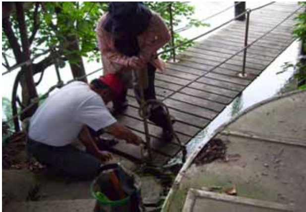
社區志工執勤一埤仔頭木棧道整修之一