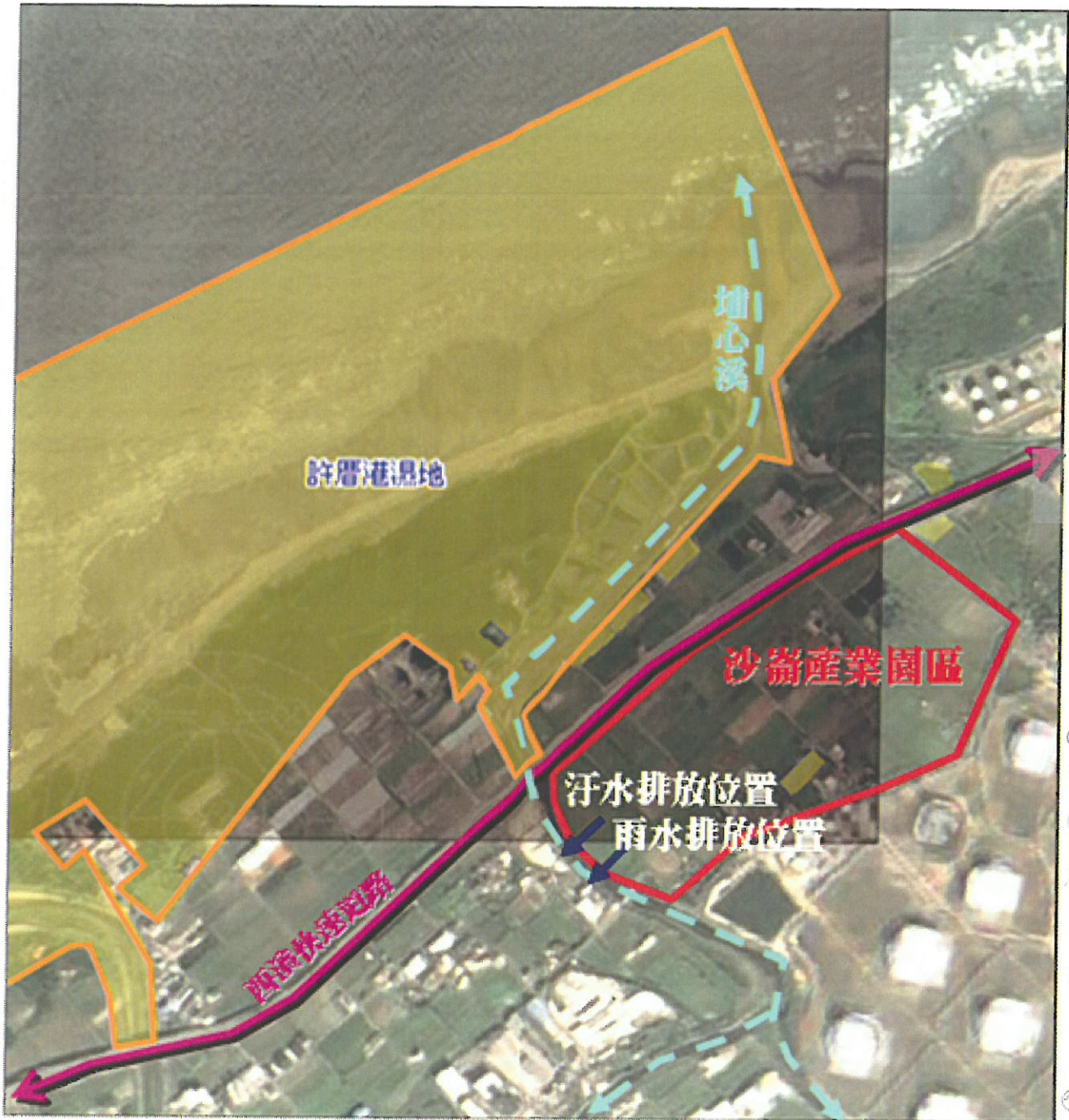
附圖三 本園區與許厝港重要濕地相對位置示意圖