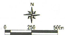
附圖二 計畫範圍示意圖