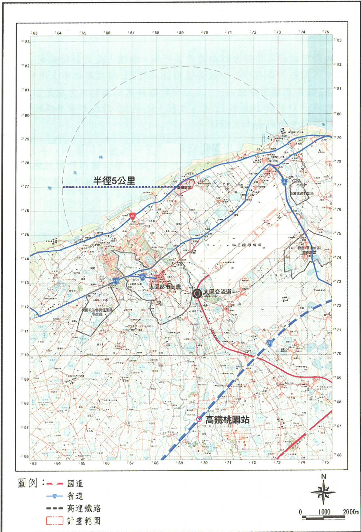
附圖一 地理位置示意圖