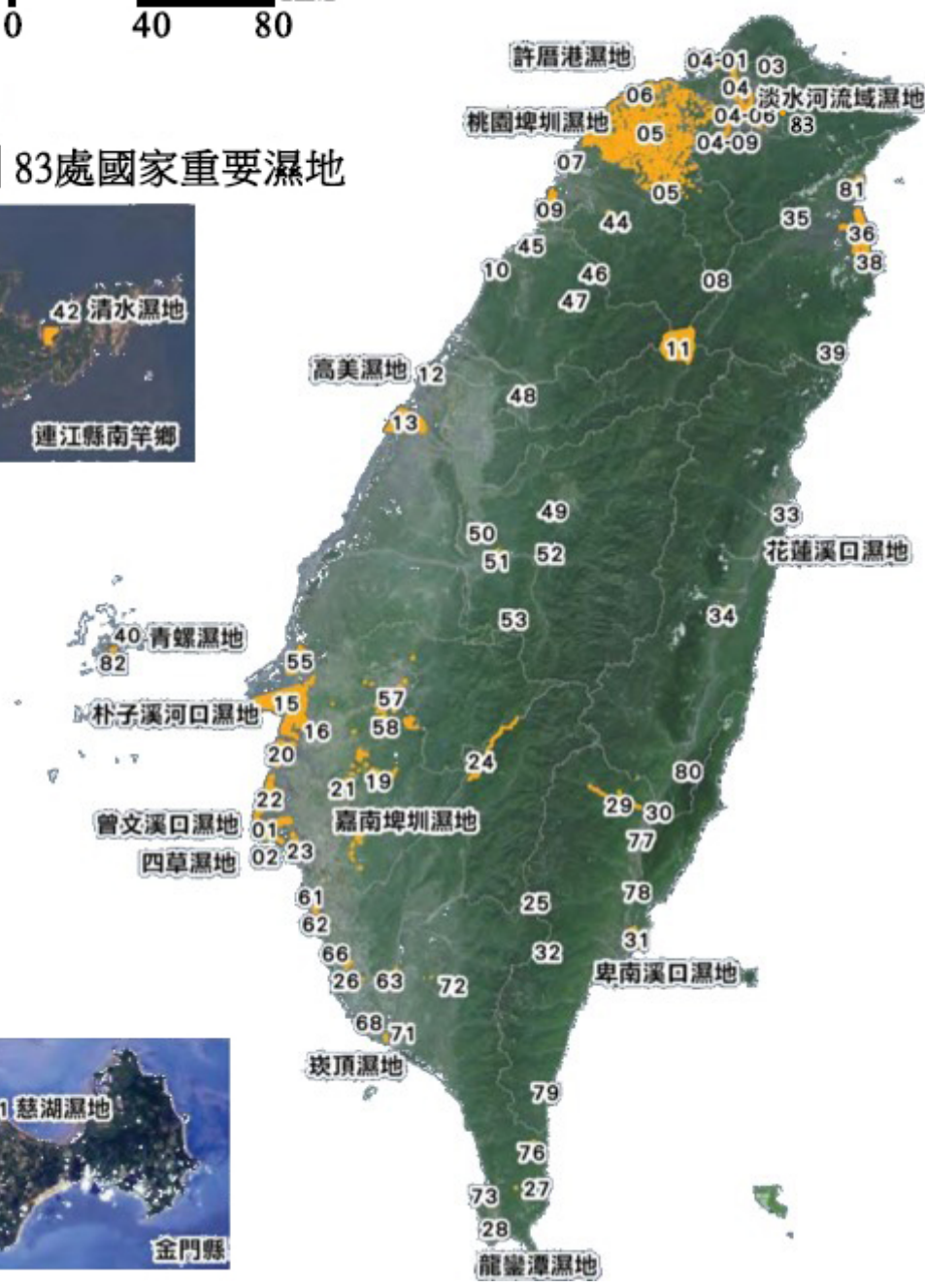
圖 1-3-1 計畫範圍圖