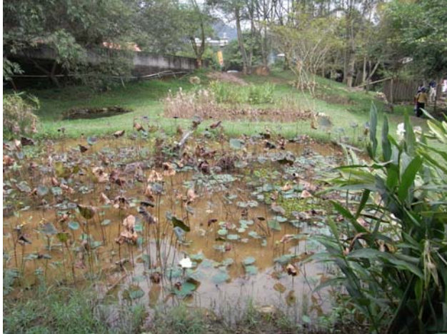
大大小小的蓮花池塘，在雨季時可是充分發揮滯洪效果