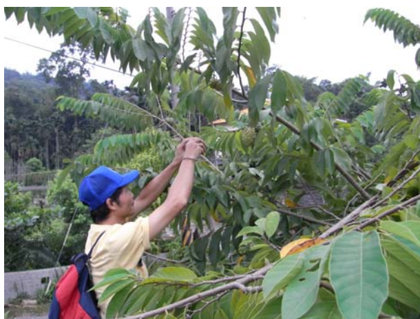
接著榮立大哥跟進