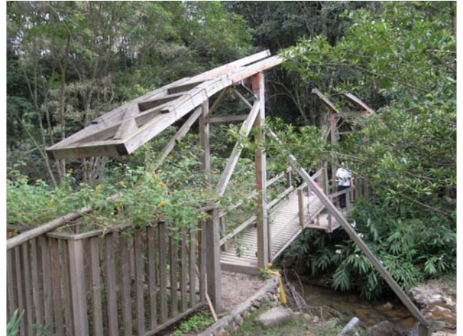
運用創意的同心橋