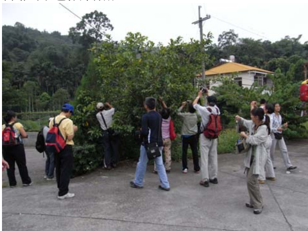
之後一群人蜂擁而上等候拍照