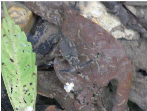
溼地裡隨處可見紅娘華