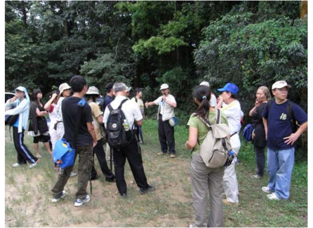
午餐後，大家來到草湳溼地，官老師又要傳遞秘笈了！