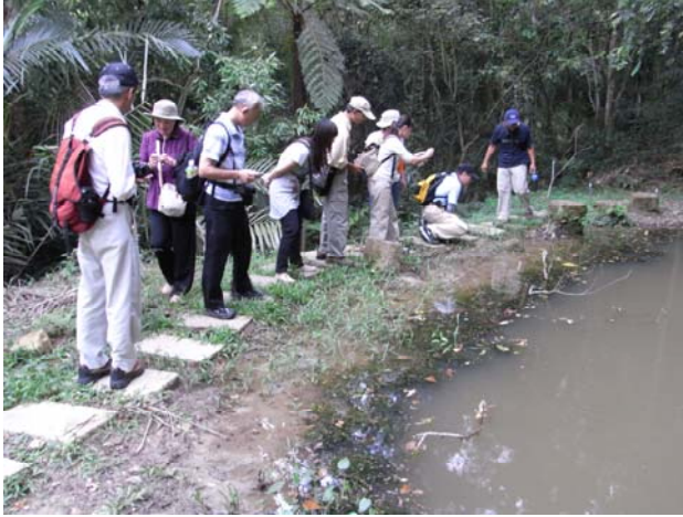
學員們專心的找尋生物