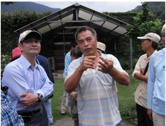
羅場長向大家解說蝴蝶農場內培植的蝴蝶