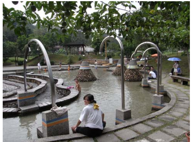
親水公園因應社區觀光客而設，由居民負責維護，營造也是為居民創造就業機會