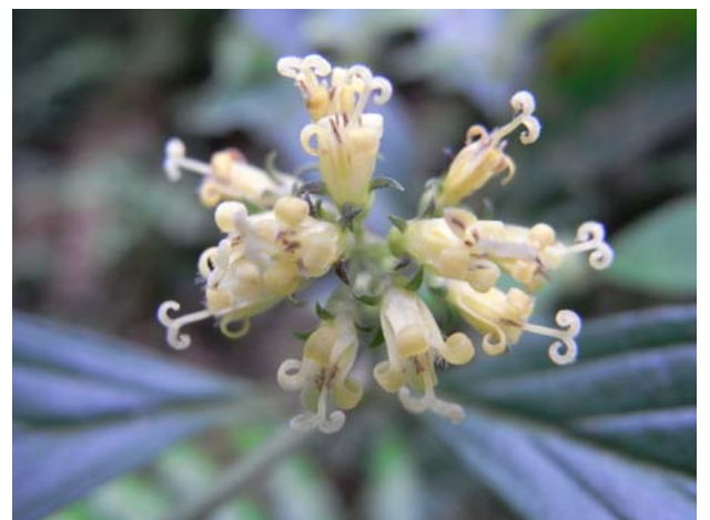
南投涼喉茶可愛的花