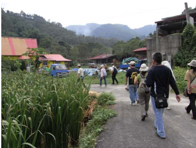
跟隨官老師走入社區莊稼田疇