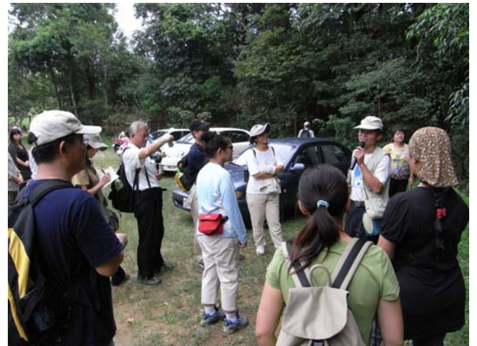
官老師分想「桃實百日青」的生活哲學，大家都聽得入神