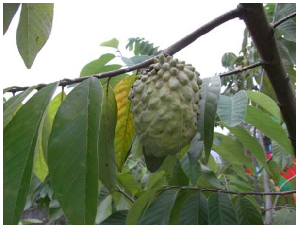
就是它---搶了桃米的驚鴻一瞥