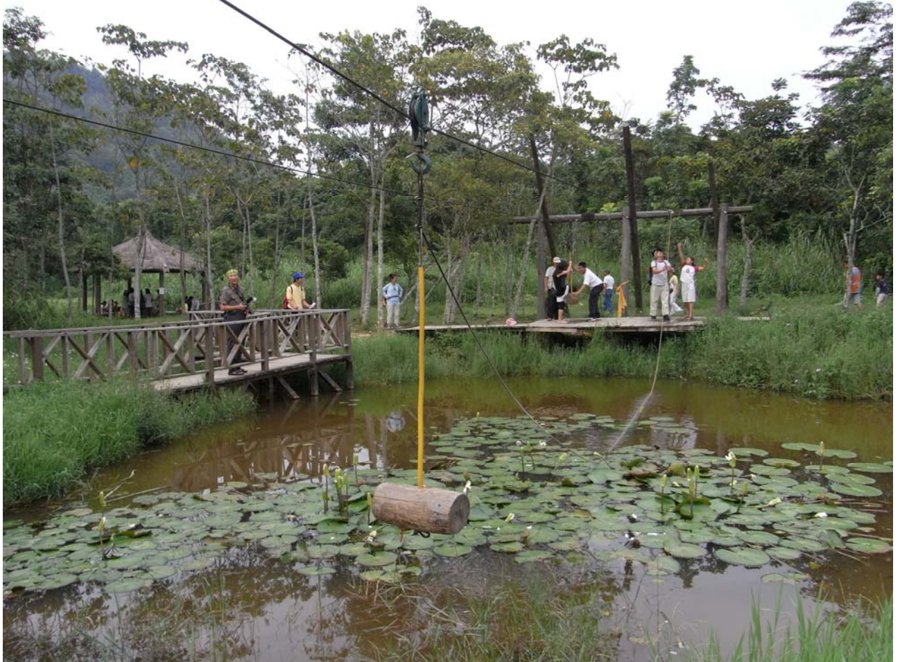
溼地裡的盪鞦韆也是社區工班創意的傑作，吸引大、小朋友們的駐足