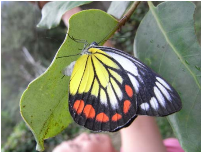
進入蝴蝶農場迎接我們的居然是黃裳鳳蝶