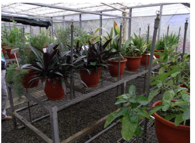
后侖苗圃中栽種許多藥用植物，真是大開眼界只可惜時間不夠不能細細品味