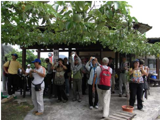
結實累累的百香果是完全用有「雞」肥喔！