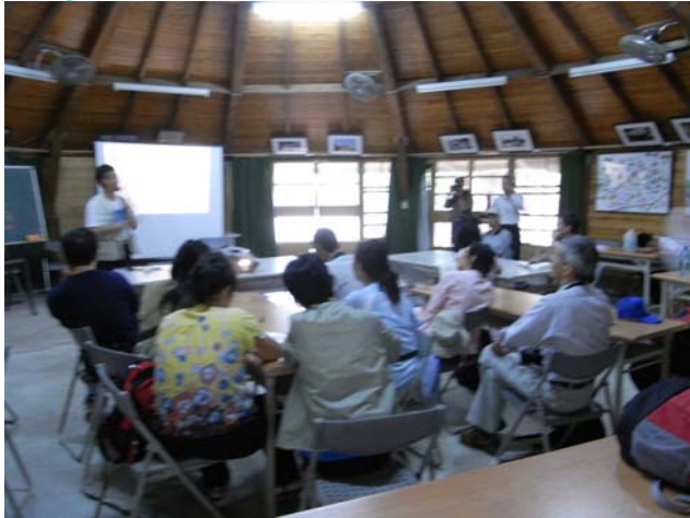
官老師在桃米青蛙小屋旁的解說中心和大家分享桃米經驗