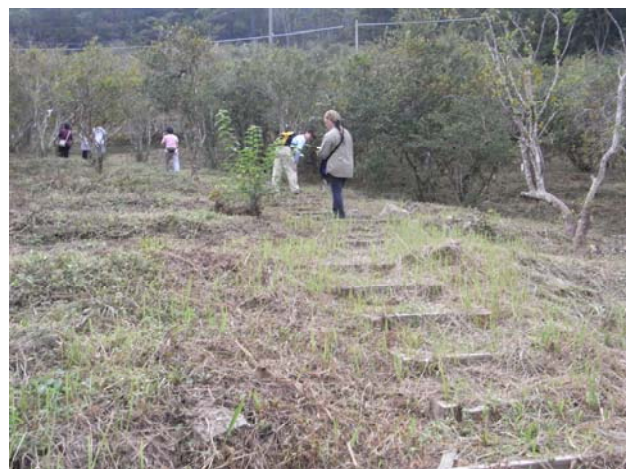
大家在小果油茶園中尋寶...還有會心一笑的通關小密碼