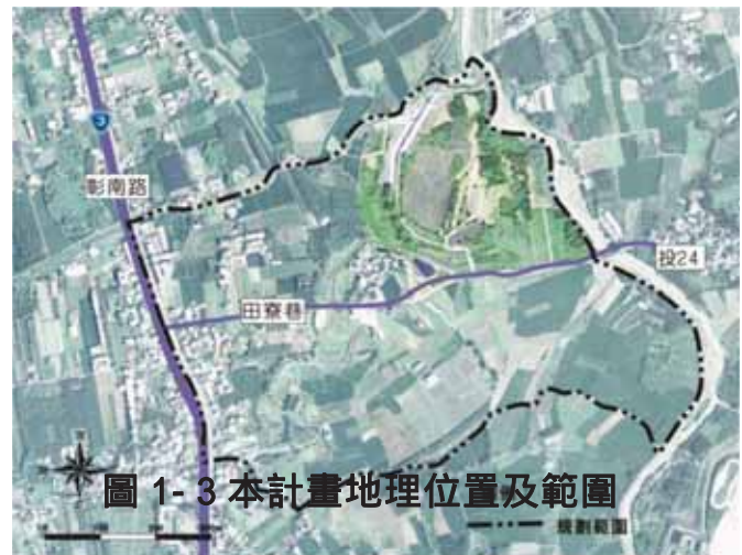
圖 1-3 本計畫地理位置及範圍

本計畫位於 南投縣名間鄉 新街村東北方，以田寮巷(投 24 鄉道)為南界、名間鄉鄉界線為北界，總面積約 46 公頃；區內有豐沛冷泉資源及湧泉聚集所形成之池塘，並有番子寮溪流域橫跨範圍內，冷泉、埤塘、濕地等水體資源豐富，其詳細分布範圍如右圖所示：