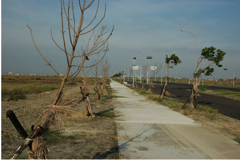
照片 1 道路北側綠帶及自行車步道

1.1-1 道路現況：濕地範圍內 1-1 道路由西 1k+690 至東端向南轉 1-6 道路終點 2k+437 目前已近完工，濕地範圍外 0k+000~1k+690 目前則仍施工中，現況如照片。