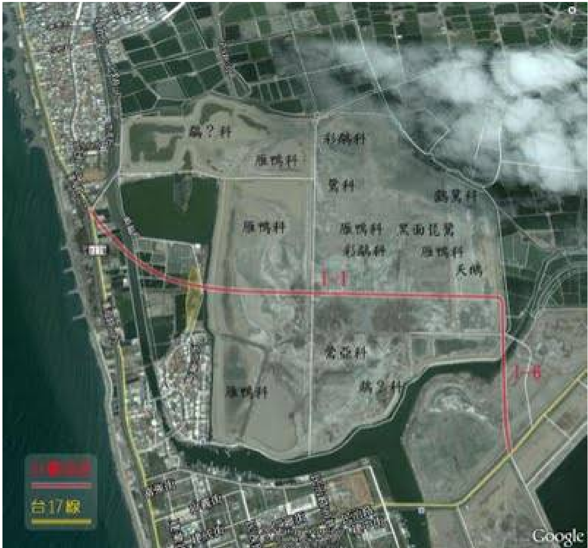
圖 2-6 鳥類分布圖