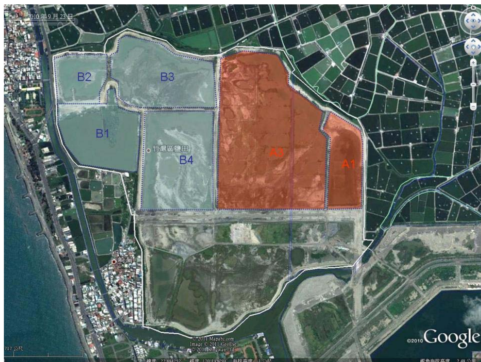
圖 2-12 茄苳濕地公園(I-1 道路以北)集水分區示意圖

本濕地經 100 年度「茄苳濕地公園棲地環境營造先期整體規劃與基本設計」案調查及初步規劃成果，因本濕地除西側開放水域約 13 公頃(如圖 3 之 B2 區)為感潮外，其他區域目前平均高程約在 EL+1~2m 間，周邊以土堤高程約 EL+2.5~4m 圍繞，本計畫將透過簡約規劃方式設置自然生態阻隔設施，減少人為影響，回復原有自然濕地景觀。