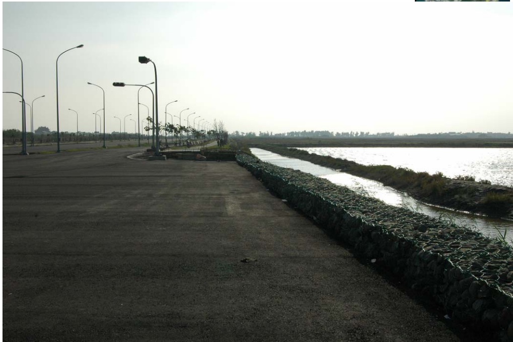
照片 2 道路北側綠帶及自行車步道