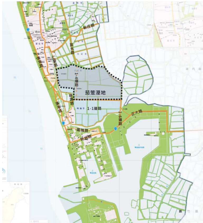
圖 2-8 基地周邊交通圖