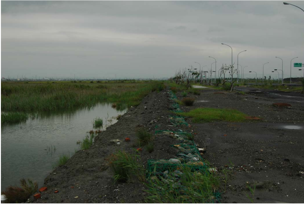
照片 3 道路北側綠帶及自行車步道