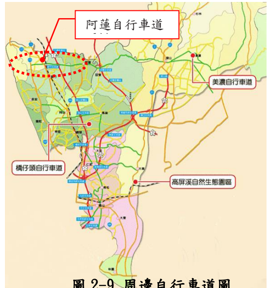
圖 2-9 周邊自行車道圖

情人碼頭海濱線→情人碼頭→海上劇場→郭常喜兵器館→興達港觀光漁市（→支線：茄萣濱遊樂區→台南黃金海岸），長 3.2km。