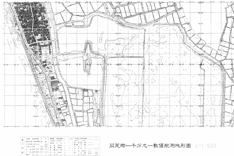
圖 2-11 茄苳濕地數值航測地形圖

3.濕地週遭土堤地形：目前濕地內基地平均高程約在 EL+1~2m 間，週邊土堤高程約 EL+2.5~4m，詳地形圖 2-11。