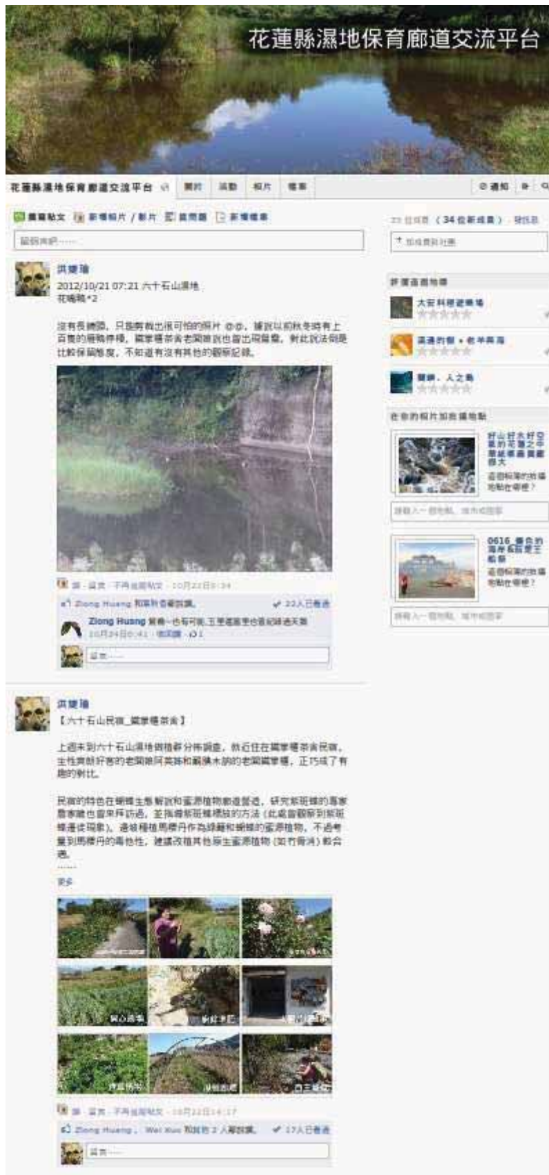
圖 55 花蓮縣濕地保育廊道交流平台頁面