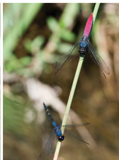
(右) 田間飛舞著生態指標「蜻蜓」。