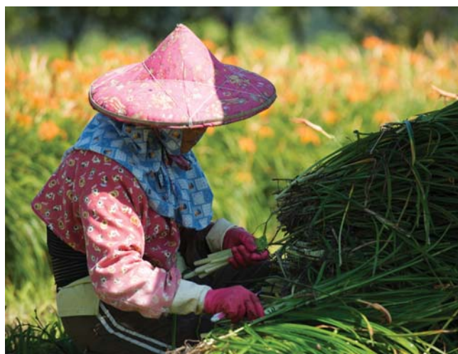
(右) 金針耐旱又耐澇，因泥炭土含水量高，花蕾、嫩莖特別細嫩。