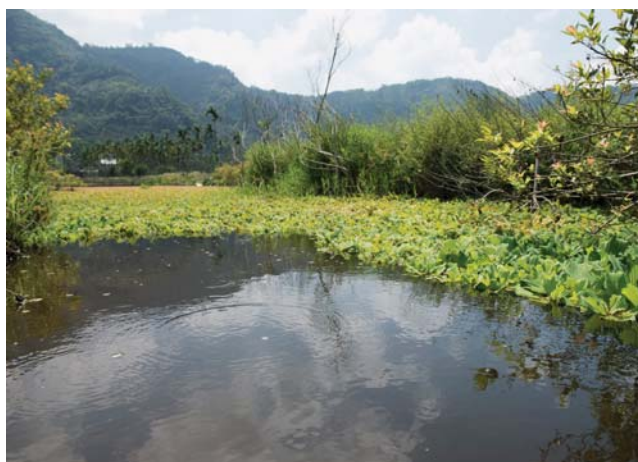
(左) 金針生命力強韌，洪水來去無礙生長，還有助水土保持。(右) 順應濕地特性調整農耕作物。