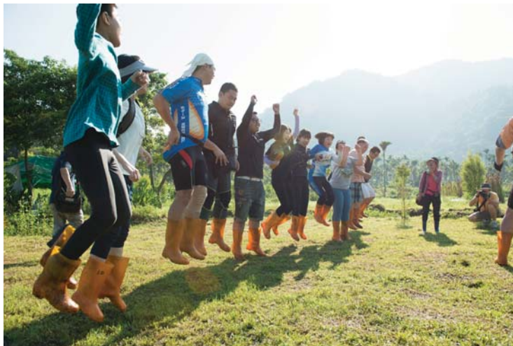
在活盆地上跳一跳，大地就像水床搖晃。

泥炭土層來自於頭社盆地原是一斛碧波，千百年來，水草碳化沉積，化成全臺少有的草泥炭土，土層深達 60 米，體驗區內準備的丈高竹竿，即使是纖細女子也能輕鬆深插入土，感受力透地心的快感。