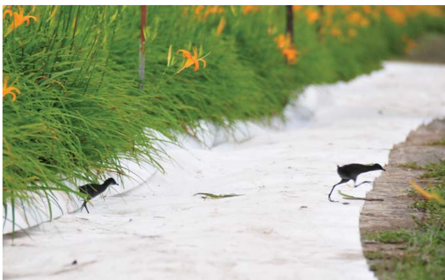
(左) 灰胸秧雞棲息於金針花田。

探訪頭社盆地的金針花海，金黃亮麗的金針花雖是主角，花間翩翩飛舞的鳳蝶、蜻蜓更吸睛，草叢還藏著各式各樣的小蟲，跳躍著繽紛多彩的生物相。