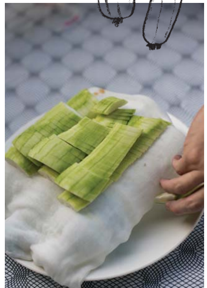
(左) 盆地另一特色農產絲瓜。