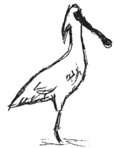
五十二甲濕地鳥況豐富、景緻優美。