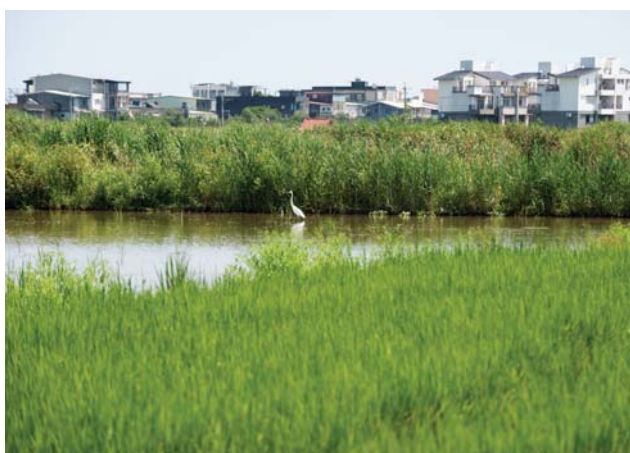
(左) 五十二甲濕地不遠處，可見樓房處處，生態亟待保護。

然而，經年累月的慣行農法，成為濕地不可承受之重，加上水田、水圳被水泥入侵，魚蝦貝類生存空間變小，鳥類數量也逐漸減少，原本到處可見的風