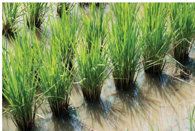
(左) 荒野圈圍濕地種植農作，避免布袋蓮蔓延。(右) 荒野透過承租、契作推無毒栽培作物。