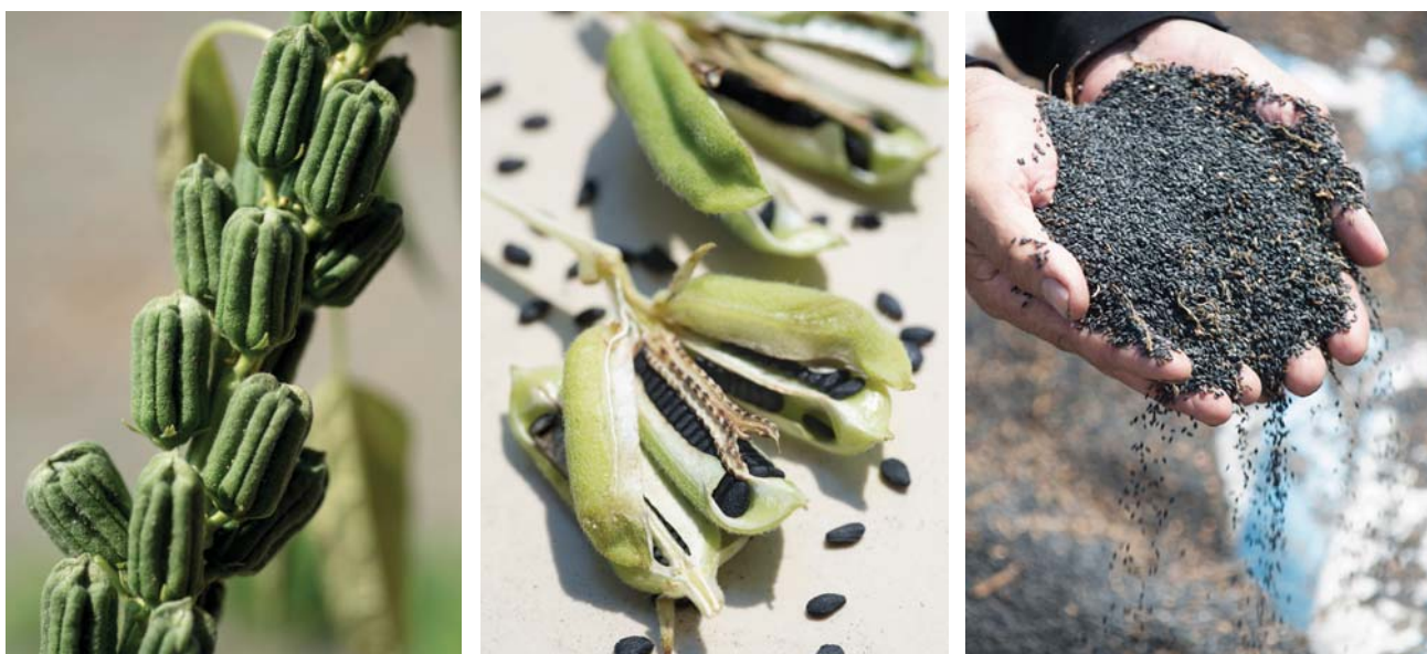
(左) 莖桿上結實累累。

鄰近五十二甲濕地的一處沙地，匍匐著花生、地瓜等低矮作物，高約 100 公分的芝麻植株顯得格外突出，8 月時節，挺直的莖桿上，有細長的葉、白色的花朵，以及密實的蒴果，而芝麻就藏在蒴果裡。