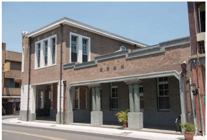
(上) 生態旅遊中，鴨母船也是體驗行程。