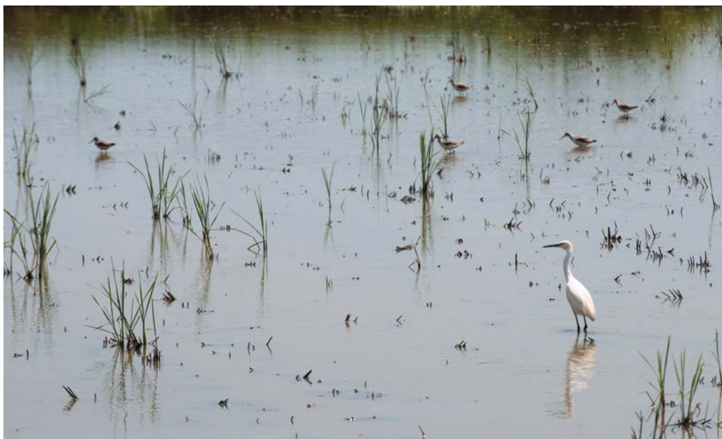
水鳥在濕地上 覓食踱步。

宜蘭冬山河名聞遐邇，每年在親水公園舉辦的童玩節吸引數十萬人潮前來，一橋之隔，便是五十二甲濕地，由於地勢低窪、長年積水，形成沼澤，成為候鳥與水鳥的天堂。