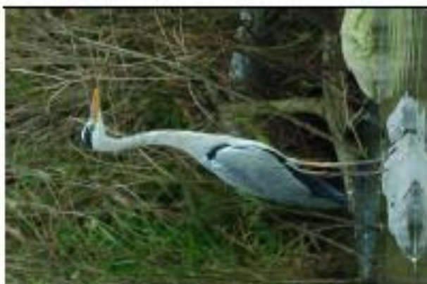
中文名：蒼鷺 學名： Ardea cinerea 遷留狀況：普通冬候鳥 身長：95 cm