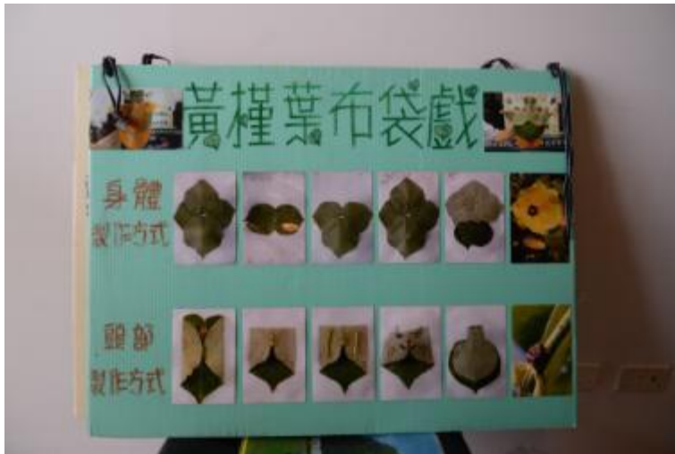
圖：黃槿葉布袋戲之製作方式示意圖