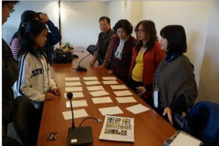
圖：參與者分組進行競賽