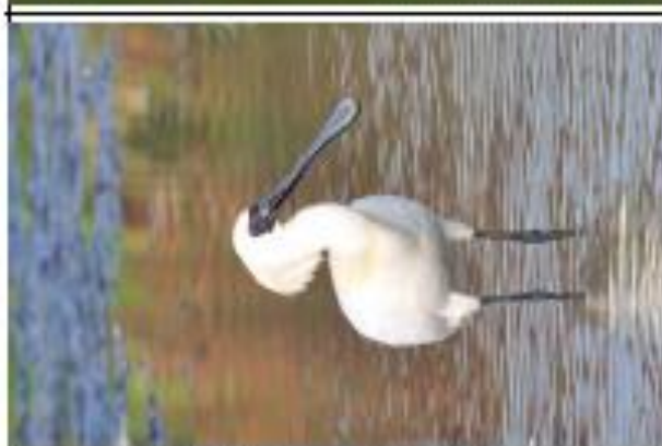
中文名：黑面琵鷺 學名： Platania minor 遷留狀況：稀有冬候鳥 身長：75 cm