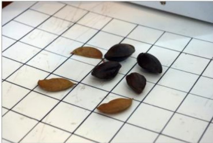
圖：遊戲類似五子棋的規則，若相同種子排成一線即算勝利