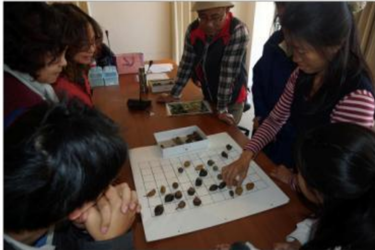
圖：參與者進行遊戲照片