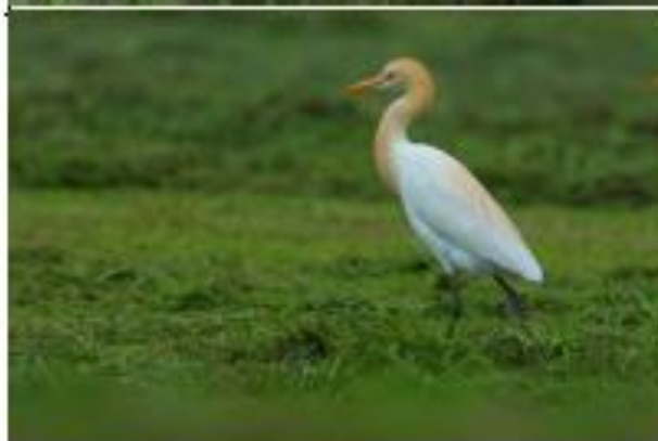
中文名：黃頭鷺 學名： Bubulcus ibis 遷留狀況：普通留鳥 身長：50 cm