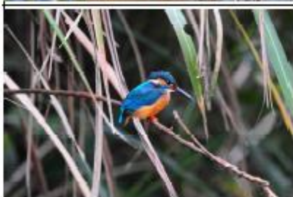
中文名：翠鳥 學名： Alcedo atthis 遷留狀況：普通留鳥 身長：16 cm