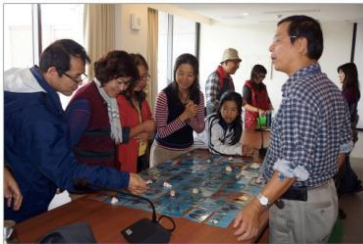
圖：參與者積極的在比對抽到的貝殼以及貝殼圖卡