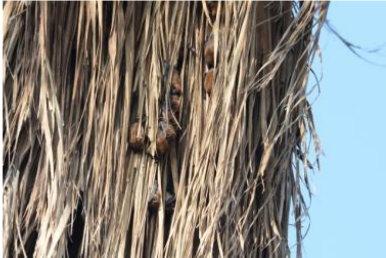
圖：椰子樹上睡覺的高頭蝠