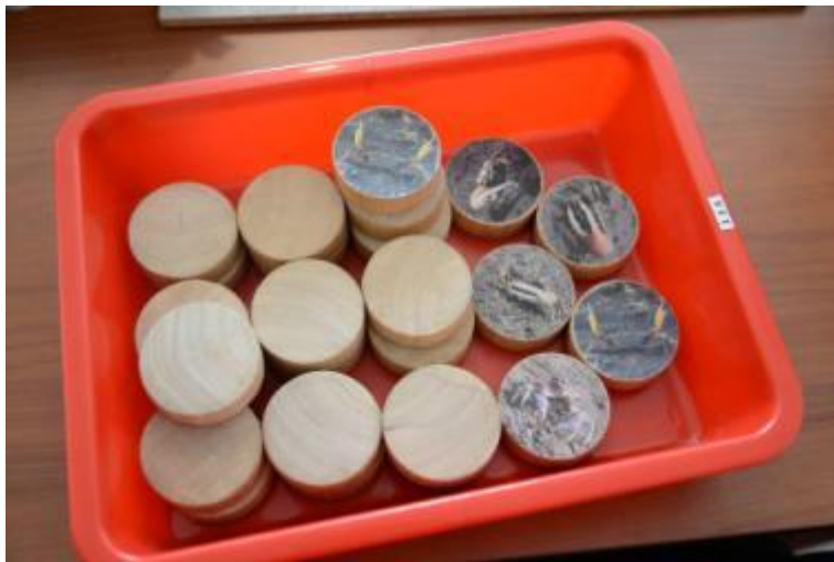
圖：將一些常見的溼地動物印在大棋子上面