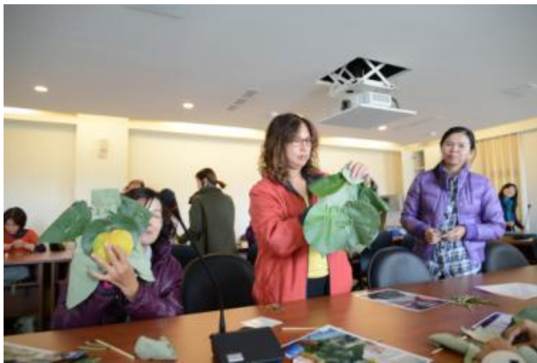
圖：黃槿葉布袋戲之製作成品