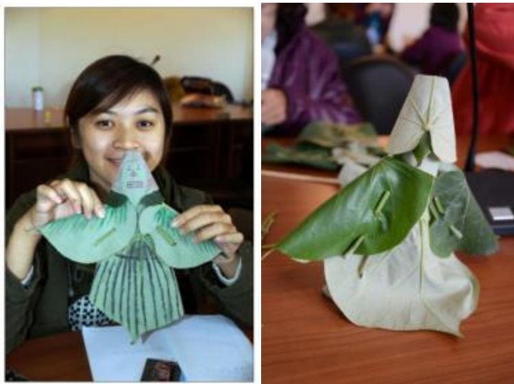
圖：黃槿葉布袋戲之成品