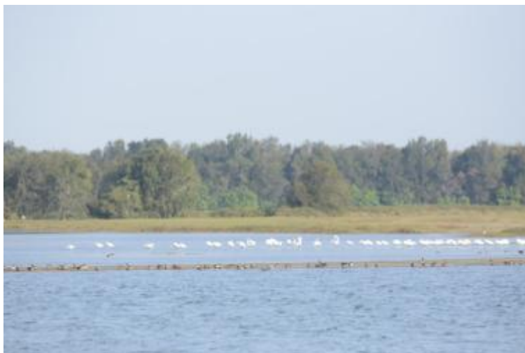
圖：鰲鼓溼地的黑面琵鷺(後)與雁鴨(前)