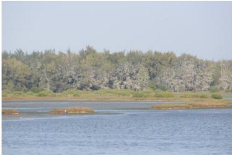
圖：鰲鼓溼地被鷓鴣糞便染白的樹林