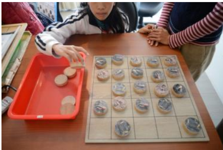
圖：參與者進行遊戲之照片